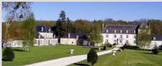
Centre des Amis de Gitta Mallasz (près de Châteauroux)