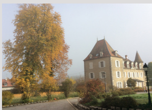
Centre de Beauregard (Besançon)