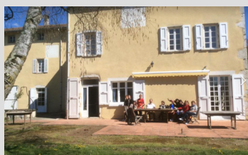
Centre de St-Sauveur (Isère)