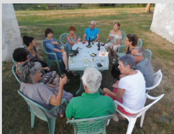
Moment convivial à la terrasse du bar