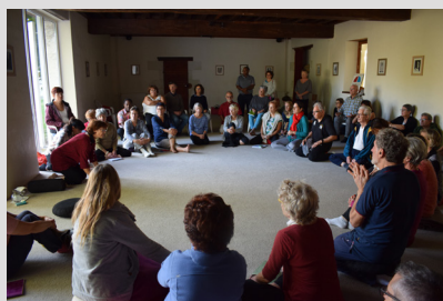
Temps de cercle pour poser sa question